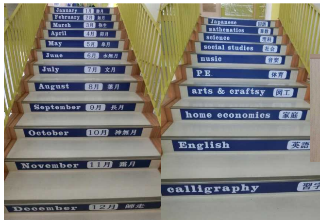
階段「12ヶ月と教科名」